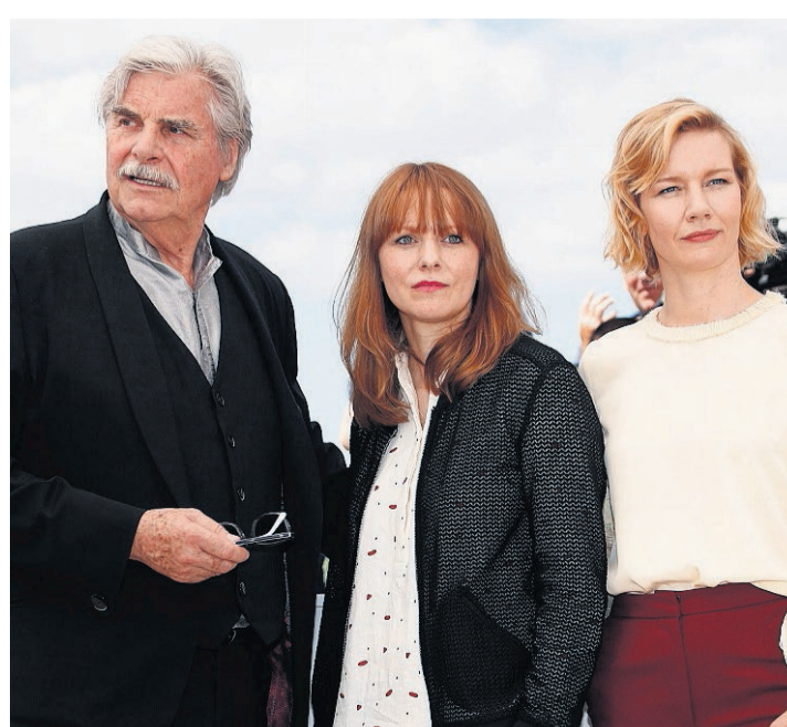
Peter Simonischek, Maren Ade, Sandra Hüller. (Cannes, 14. Mai 2016)

Grossartig ist auch, wie Maren Ade ihre Figuren subtil aus der anfangs vorgenommenen Verankerung im realistischen Sozialdrama (für das Rumänien ein fruchtbares Terrain ist) löst und sie durch Überhöhung zu bigger than life -Kinofiguren adelt, etwa